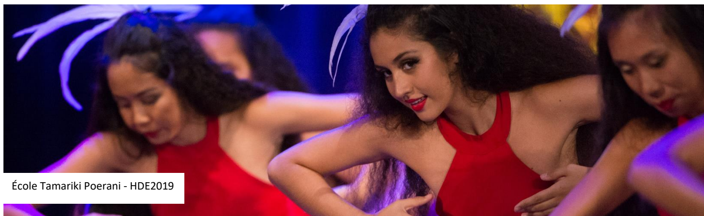
École Tamariki Poerani - HDE2019

Tout au long de l'année les élèves s'appliquent et travaillent sur les pas de danse traditionnelle, la coordination corporelle, l'endurance et la force des 'otea, la grâce et surtout l'émotion des 'aparima.