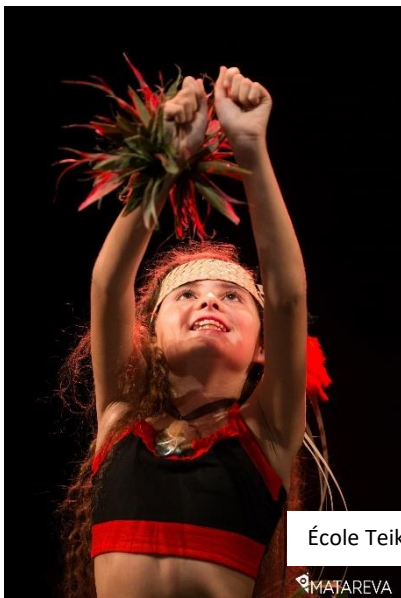
École Teikohai - HDE2019

L'école Teikohai est située sur le motu d'Arue et existe depuis le mois de mai 1998. Elle a toujours accueilli principalement des élèves métropolitaines installées à Tahiti pour une durée de 2 à 4 ans.