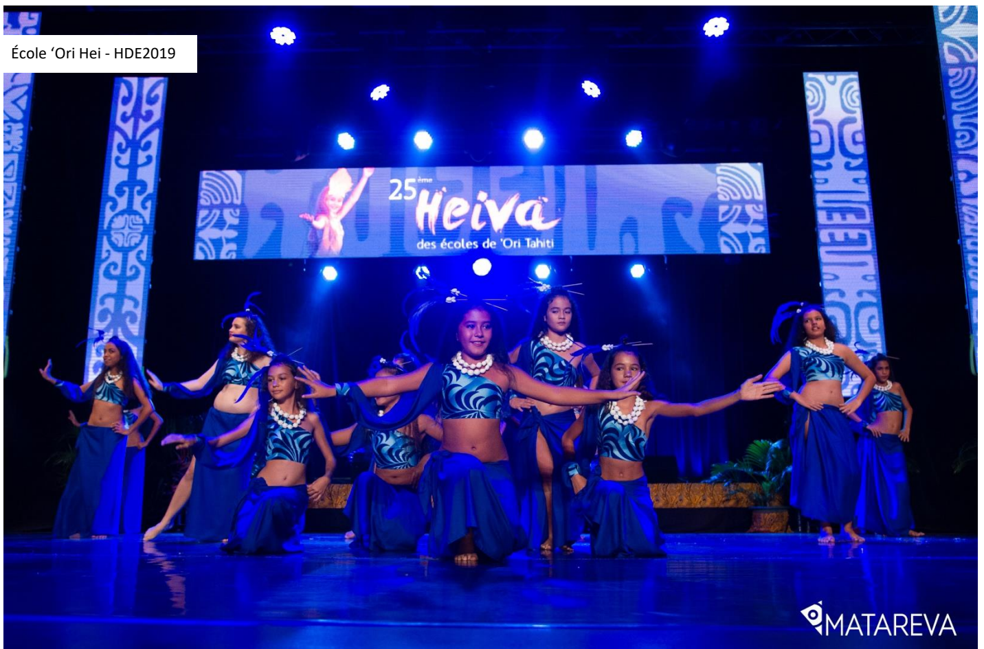
École 'Ori Hei - HDE2019