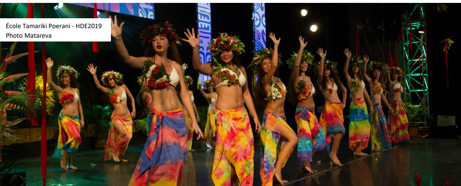
École Tamariki Poerani - HDE2019